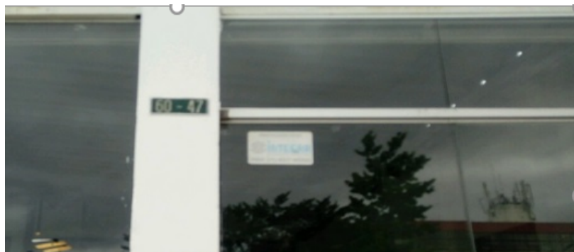
FOTOGRAFÍA No. 3: Vista de la Nomenclatura del inmueble donde se encuentra instalada la valla tubular.