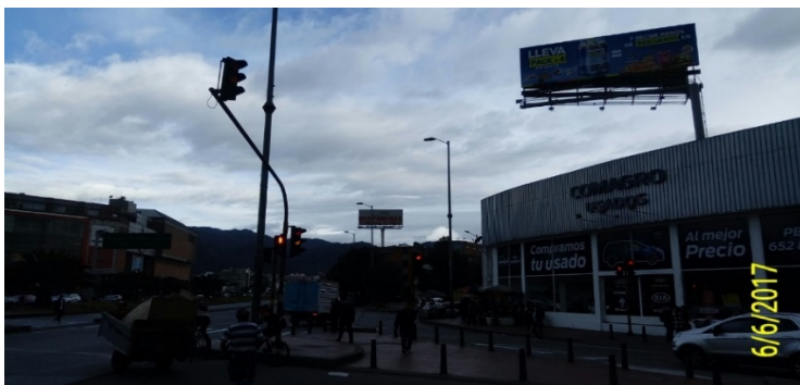
FOTOGRAFÍA No. 1: Vista panorámica de la valla tubular, ubicada en la Av. Calle 100 No 60 -47 (Dirección catastral), orientación Oeste – Este.